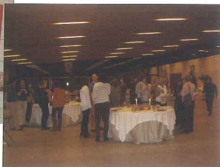
Cena en Pazo de Cea