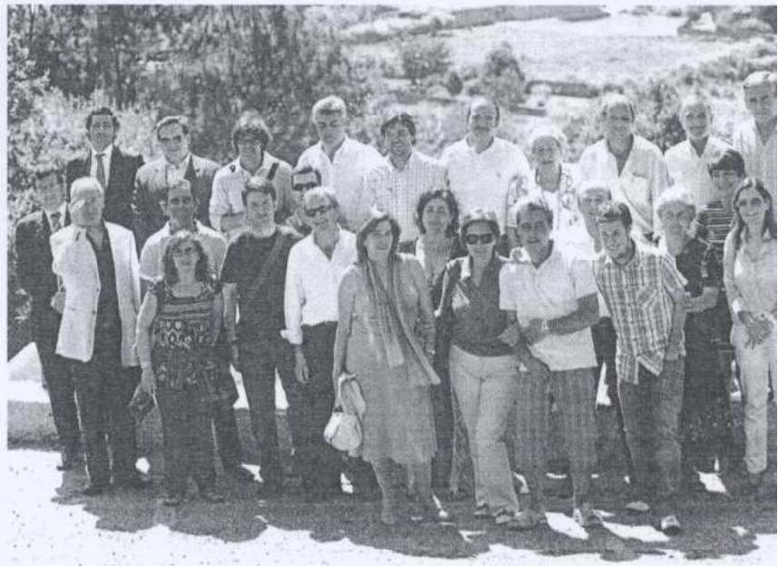
Los colaboradores de Radio Voz despidieron la temporada con una comida en el Soriano