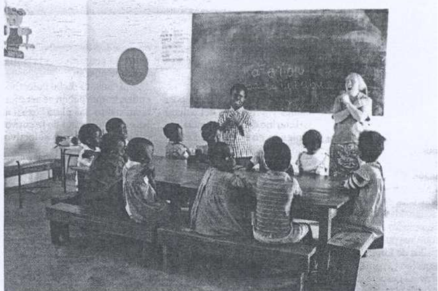
La ONG viguesa Humi, que anoche celebró cena solidaria en Panxón, atiende a 200 niños en Zambia